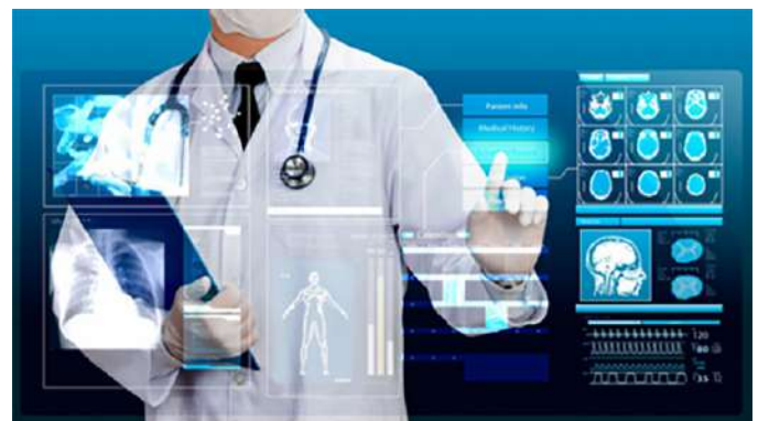
FIGURA 2. LA HABILIDAD DE USAR IOT PARA ASIGNAR CARGAS PARA EQUIPOS MÉDICOS

Dentro del mundo cotidiano, el Iot tiene la habilidad para asignar cargas para equipos de médicos, ya que con eso puede reducir las listas de esperas en centros diagnósticos. El flujo de que se puede mostrar datos provee una imagen completa de la enfermedad del paciente, permitiéndoles a los doctores responder a cualquier cambio de manera oportuna. Dispositivos especiales miden datos biométricos importantes del paciente y los pasan a la nube para procesamiento y almacenamiento. De esta manera, las enfermeras pueden visitar las salas de los pacientes que estén en necesidad en ese momento en particular.